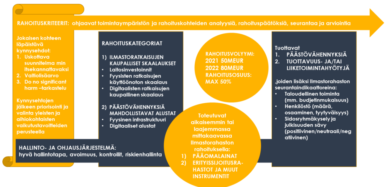
Kuva 1 Yhteenvedo strategiasta

Ilmastorahasto toimii hyvän hallintotavan mukaisesti ja noudattaa toiminnassaan avoimuutta ja eettisiä sääntöjä. Yhtiön päätöksenteko- ja valvontamekanismit on kuvattu hallinto- ja ohjausjärjestelmän selvityksessä strategian liitteenä. Rahoitustoiminta käynnistyy 1H/21 aikana ja tavoiteltu rahoitusvolyymi on 50MEUR ensimmäisenä toimintavuotena ja 80MEUR vuodessa sen jälkeen.