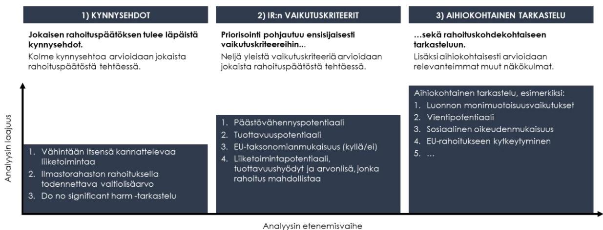
Kuva 2 Rahoituskriteerit

Ilmastorahaston hallitus on hyväksynyt toimiohjeen (LIITE 1) liitteenä sekä kuvassa 2 alla esitetyn kolmiportaisen kriteeristön yhtiön käyttöön toiminnan käynnistyessä.