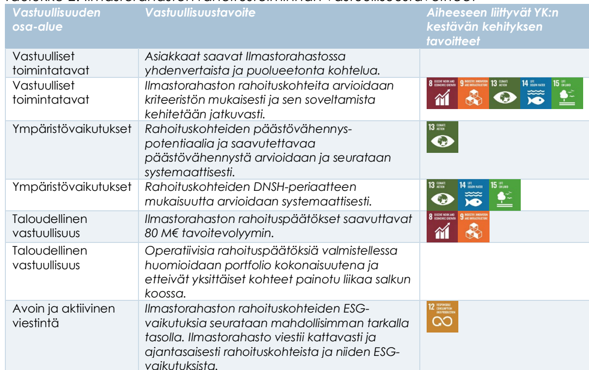
Taulukko 2. Ilmastorahaston rahoitustoiminnan vastuullisuustavoitteet

Rahoituskohteiden vaikuttavuus on keskeisin tekijä valittaessa Ilmastorahaston lopullisia rahoituskohteita ja yhtiön sijoituspolitiikassa käydään tarkemmin läpi Ilmastorahaston kriteeristön – ja sitä kautta ESG-ulottuvuuksien – soveltamisesta yhtiön rahoitusprosessissa. Yhtiön operatiivisessa toiminnassa sijoitustoiminnolla on analyysivastuu potentiaalisten rahoituspäätösten ESG-ulottuvuuksien arvioinnista ja jokainen kohde arvioidaan etenkin ympäristökohtien, erityisesti päästövähennyspotentiaalnin, osalta ennen päätöksen syntymistä. Ilmastorahaston rahoitustoiminnan vastuullisuustavoitteet on kuvattu taulukossa 2.