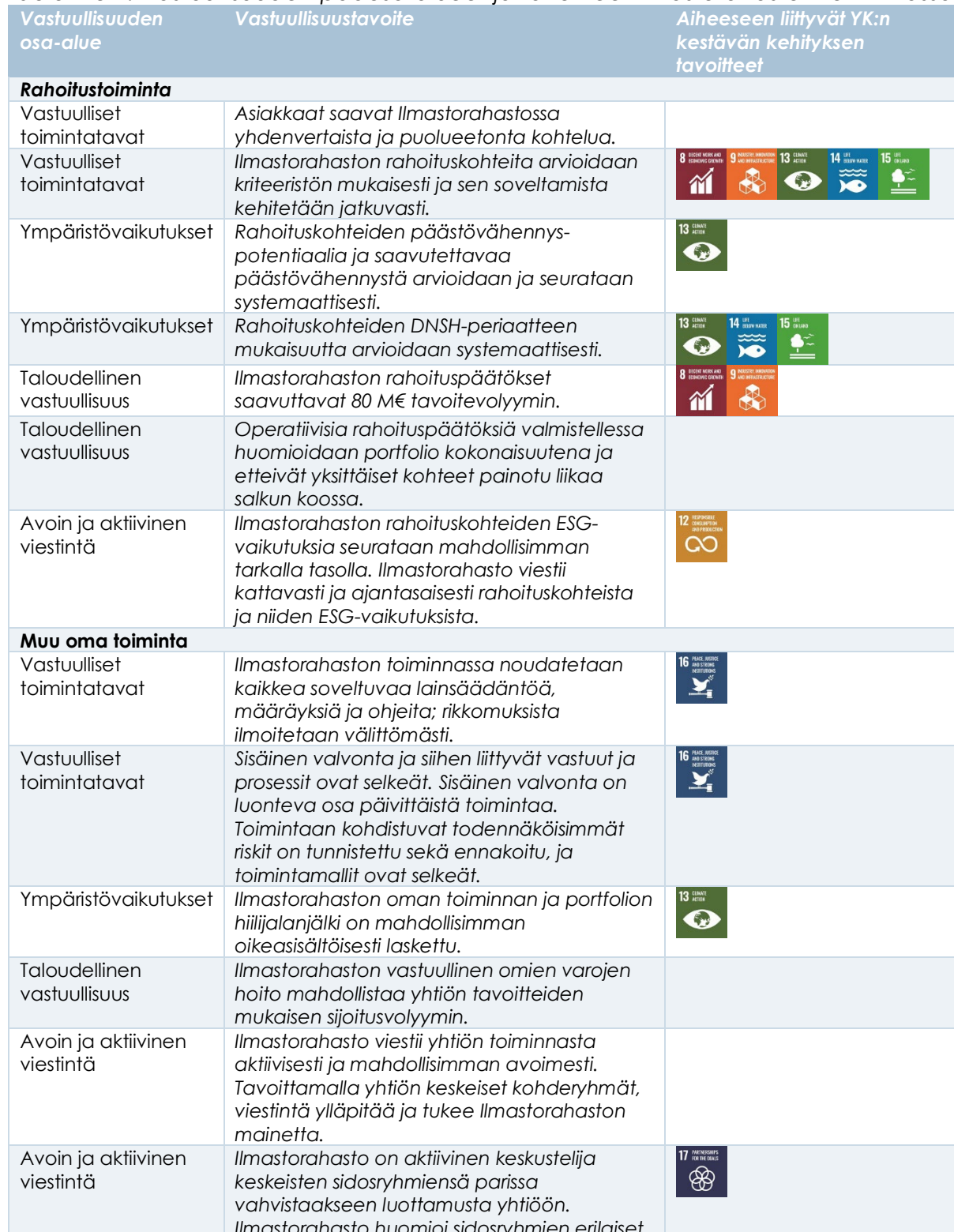
Taulukko 1. Vastuullisuuden pääosa-alueet ja tavoitteet Ilmastorahaston toiminnassa

myös tavoitteisiin liittyvät YK:n kestävän kehityksen tavoitteet (SDG eli Sustainable Development Goals) soveltuvien osin.