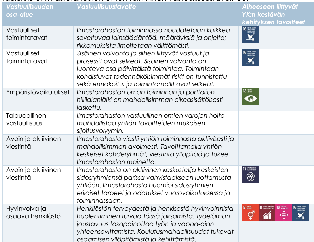
Taulukko 3. Ilmastorahaston oman toiminnan vastuullisuustavoitteet

Ilmastorahasto toimii hyvän hallintotavan mukaisesti ja noudattaa toiminnassaan avoimuutta sekä eettisiä sääntöjä. Ilmastorahasto edistää vastuullista toimintatapaa niin hallinnon, henkilöstön, ympäristön kuin talouden näkökulmista yhtiön kaikilla toiminnan osa-alueilla. Vastuullisuusaiheet ovat olennainen osa yhtiön jokapäiväistä työtä. Yhtiön omalle toiminnalle asetetut vastuullisuustavoitteet on kuvattu taulukossa 3.